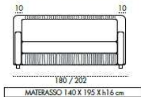
Divano 3 Posti