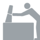
APERTURA A RIBALTA