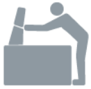
APERTURA A RIBALTA